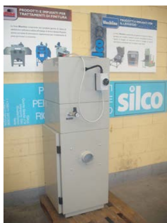
Cabinet du filtre 3PA10C

Nos systèmes de filtration/aspiration permettent d'optimiser les conditions de travail dans la cabine. D'après la directive CE, la cabine doit être dotée d'une cartouche filtrante nettoyage à contre courant. Le filtre 3PA10C est universel.