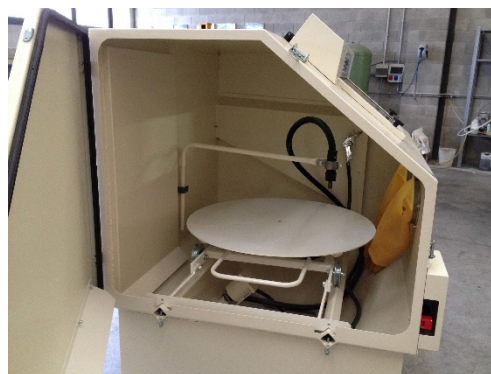
Intérieur de la cabine SP 12 avec table rotative en manuel